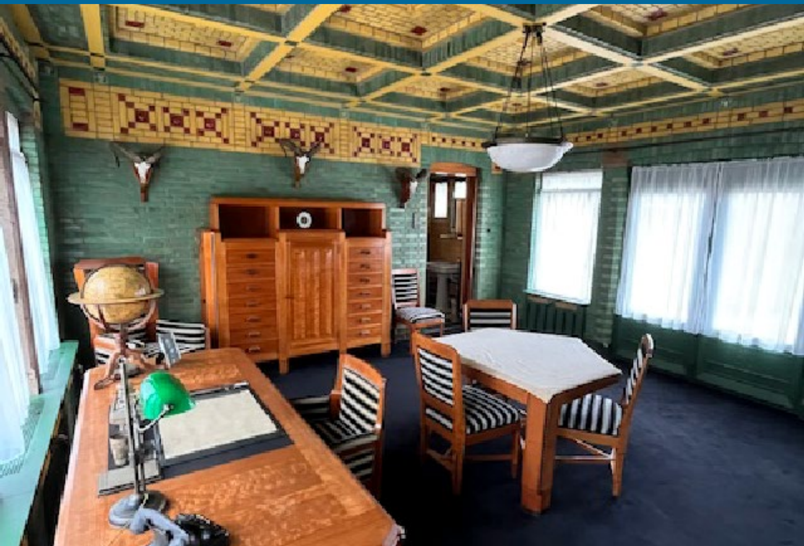
Foto: kamer van meneer in Jachthuis Sint Hubertus