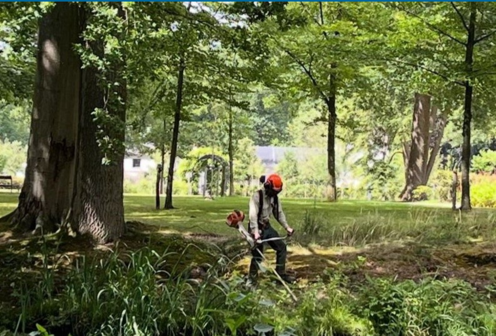
Foto: Onderhoudswerkzaamheden op landgoed Staverden in juli 2025