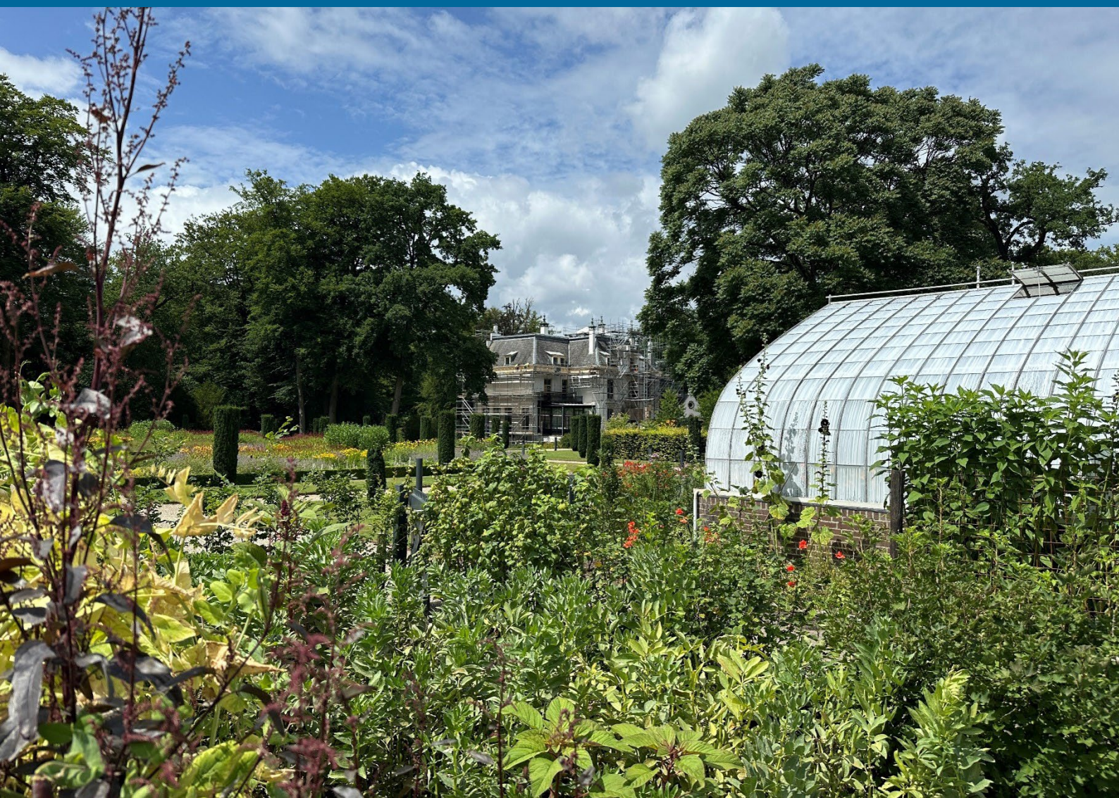
Foto: Huis Staverden in juli 2025