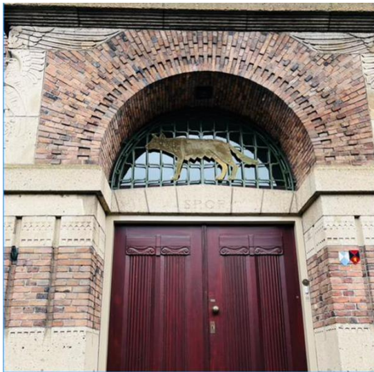
Foto entree Museum Kam in Nijmegen

In dit rapport zijn eerst de conclusies en aanbevelingen over het beleid beheer collectie (hoofdstuk 1) en de administratieve organisatie (hoofdstuk 2) beschreven. Vervolgens de conclusies en aanbevelingen over de registratie en administratie (hoofdstuk 3), het behoud (hoofdstuk 4) en de veiligheidszorg (hoofdstuk 5). Tenslotte zijn de conclusies en aanbevelingen weergegeven over de toegankelijkheid van de collectie (hoofdstuk 6).