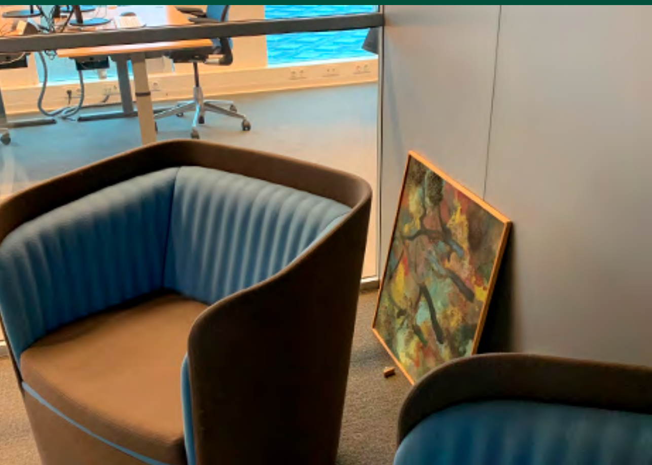
Afbeelding 4 Schilderij op de grond geplaatst in een vergaderruimte van een ministerie.