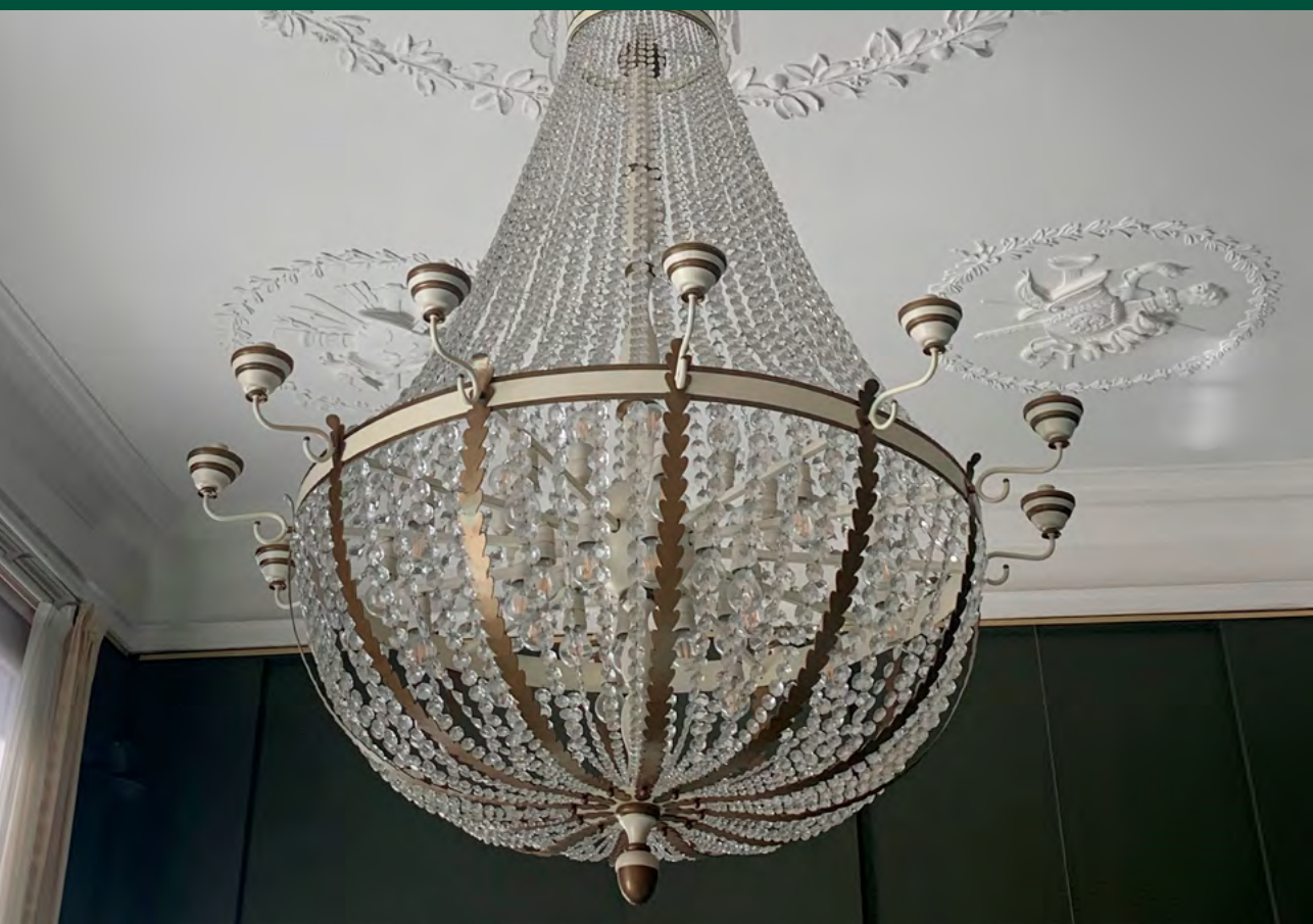
Afbeelding 5 Een kroonluchter uit de rijkscollectie in beheer van de Tweede Kamer.