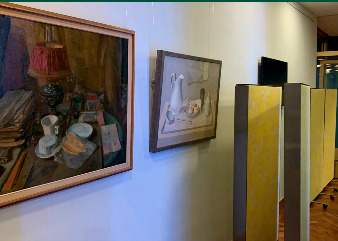
Afbeelding 2 Verrijdbare panelen naast schilderijen in een bedrijfsrestaurant van een ministerie.