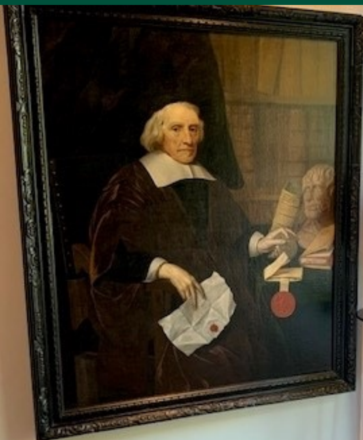
Afbeelding 3 Een schilderij uit de rijkscollectie in beheer van het ministerie van Algemene Zaken. Afgebeeld is Jacob Cats.