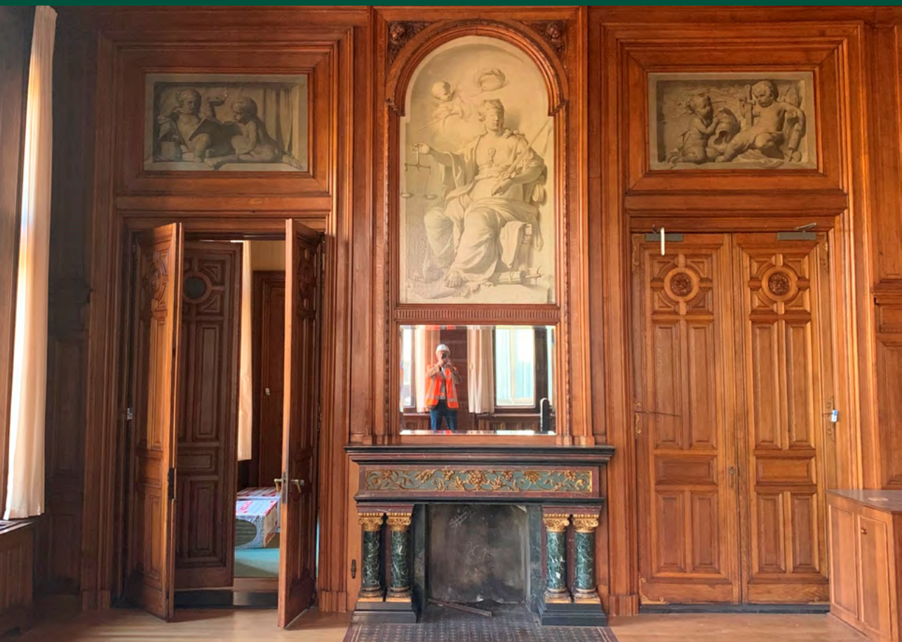
Afbeelding 1 Schilderij in een van de gebouwen van de Tweede Kamer op het Binnenhof.