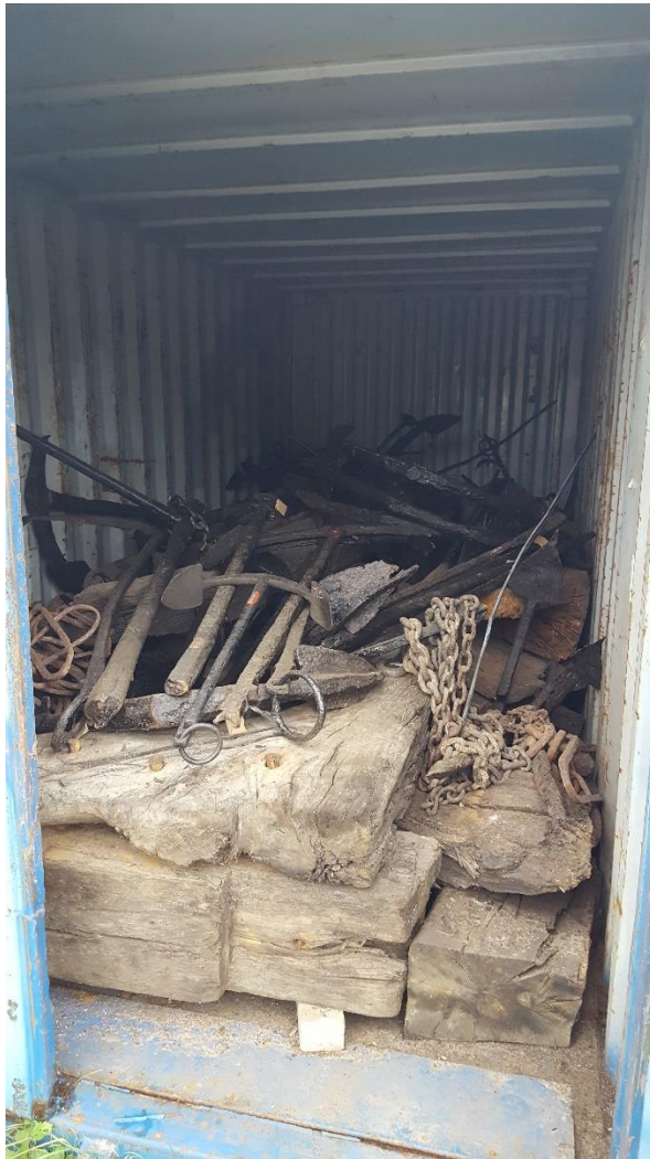
Afbeelding 1.0 -inhoud van één van de vijf zeecontainers op de locatie van de Bataviawerf bestaande uit ongeconserveerd scheepshout en ankers