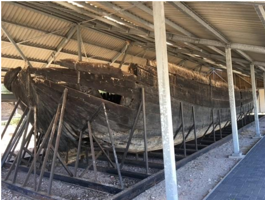
Afbeelding 2.0 -Het scheepswrak De Zeehond in een open behuizing op het voormalig terrein van de Rijksdienst voor het Cultureel Erfgoed

Door beperkingen in de beschikbare personele capaciteit kan geen intensievere controle op de conditie van objecten worden toegepast. Zo is het voornemen om jaarlijks een derde van de collectie op conditie te controleren nog niet geoperationaliseerd.