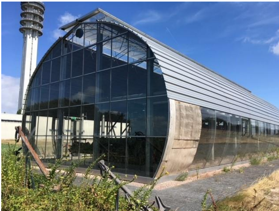
Afbeelding 3.0 -Het scheepswrak De Beurtvaarder in een gesloten en gerepareerde behuizing op het voormalig terrein van de Rijksdienst voor het Cultureel Erfgoed

Het ministerie van OCW stelt vanaf 2022 geen subsidie op grond van de Erfgoedwet beschikbaar voor de kosten van de publiekstaken. Dit is bevestigd door de beleidsdirectie van het ministerie. Er zijn afspraken gemaakt met de provincie Flevoland over de subsidiëring van de structurele en incidentele kosten die verband houden met het NSD. In hoofdlijnen richt het ministerie van OCW zich daarbij op de beheer en conserveringstaken en de provincie op de publiekstaken.