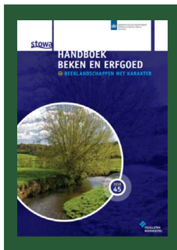
Afbeelding 5: Omslag Handboek Beken en erfgoed STOWA en RCE (2018)

uitgebracht met de Stichting Toegepast Onderzoek Waterbeheer (STOWA). Het boek laat zien dat een historische analyse kan helpen bij beekherstelprojecten door waterschappen. Een aantal POM's was aanwezig bij de presentatie van het handboek en voelde zich geïnspireerd om na te gaan of op hun bezittingen ook historische waterlopen hersteld zouden kunnen worden. Overwogen wordt om in de Database Incidenten Cultureel Erfgoed 47 bij te gaan houden welke schade er door droogte ontstaat aan het groene erfgoed. In de RCE-brochure "Cultuurhistorie als kennisbron voor de klimaatstresstest" 48 worden gemeenten opgeroepen om de gevaren voor het erfgoed mee te wegen 49 in hun jaarlijkse testen. De nieuwe regeling Erfgoed Deal 50 biedt de komende jaren provincies en gemeenten de mogelijkheid om aanvragen in te dienen, waar klimaatadaptatie een van de drie hoofdthema's is. Er is voor deze regeling een budget van €40 miljoen beschikbaar.