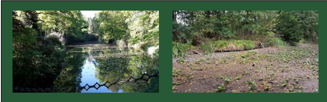
Afbeelding 3. Vijver en drooggevallen vijver op een landgoed 29

Uit onderzoek van Stichting Kastelen, Buitenplaatsen & Landgoederen (SKBL, september 2019) onder kasteel- en landgoedeigenaren geeft 78% van de respondenten aan blijvende schade te verwachten als gevolg van de droogte. Het SKBL-onderzoek 30 kreeg media aandacht van het NOS-journaal, de Telegraaf en EenVandaag 31 .