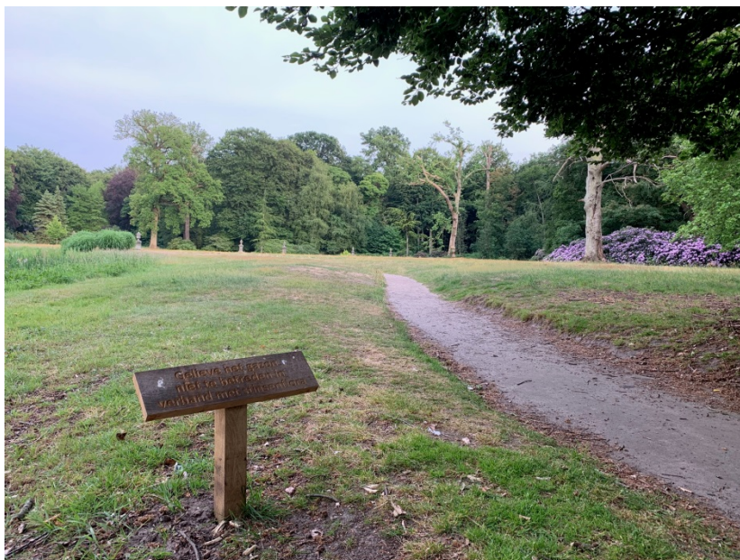
Afbeelding 2. Bord met opschrift "Gelieve het gazon niet betreden in verband met stinzenflora."

Planten in de onmiddellijke omgeving van gebouwen ondervinden hinder door de uitstraling van de warmte door de stenen. Stinzenplanten die vochtig moeten staan zoals geelsterren kievietsbloem en holwortel lijken zich aan te passen. Ook is het is de vraag wat de droogte doet met de kwaliteit van de bodem. Als de bodemsamenstelling gaat veranderen door de droogte kan dat effect hebben op stinzen.