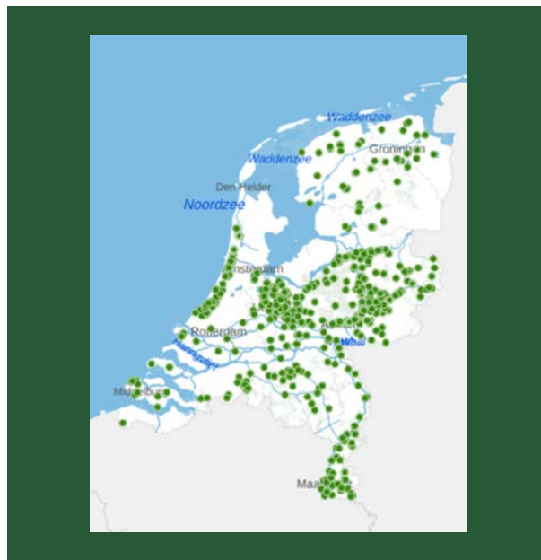
Kaart 1. Overzichtskartaal rijksbeschermd buitenplaatsen 11

kent zo'n 1400 groene rijksmonumenten die zijn opgenomen in het monumentenregister 10 .