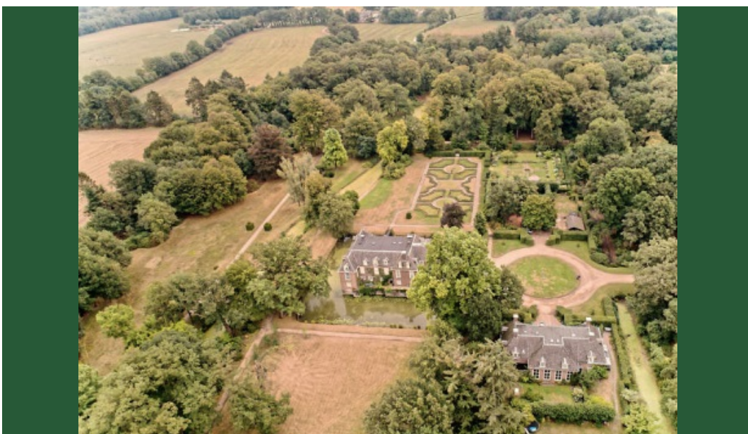
Afbeelding 6. Luchtfoto met zichtbare droogte op het landgoed de Wiersse

Droogte op de Wiersse 54 , fragment uit de nieuwsbrief, maart 2019