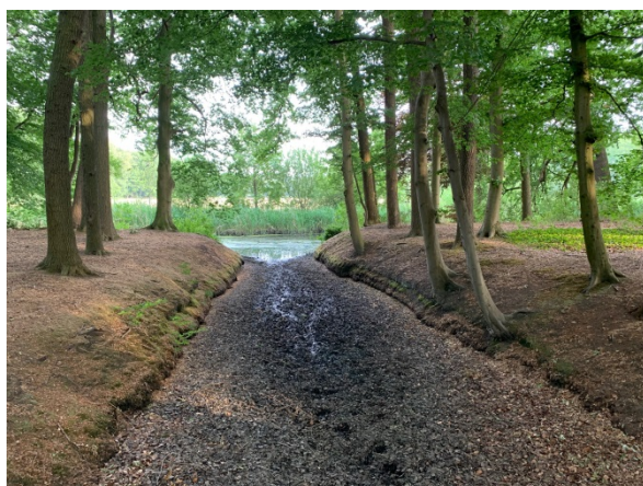
Afbeelding 1. Drooggevallen sloot kasteelbos Renswoude, juni 2020

De Samenvatting bevat de globale aanbevelingen en conclusies. In de Inleiding (hoofdstuk 1) wordt het onderzoek toegelicht. De instandhoudingsplicht (Erfgoedwet) en de verdringingsreeks oppervlakte wateren en grondwaterbeheer (Waterwet) worden toegelicht in hoofdstuk 2. In Droogte en groene rijksmonumenten (hoofdstuk 3) staat het verslag van de interviews met eigenaren. In Beleid en Droogte (hoofdstuk 4) is een weergave opgenomen van de gesprekken met de beleidsmakers droogte en erfgoed. In de bijlagen respectievelijk een blik op de casus droogte op de Wiersse (1), overzicht gesprekspartners (2) en gebruikte bronnen (3).