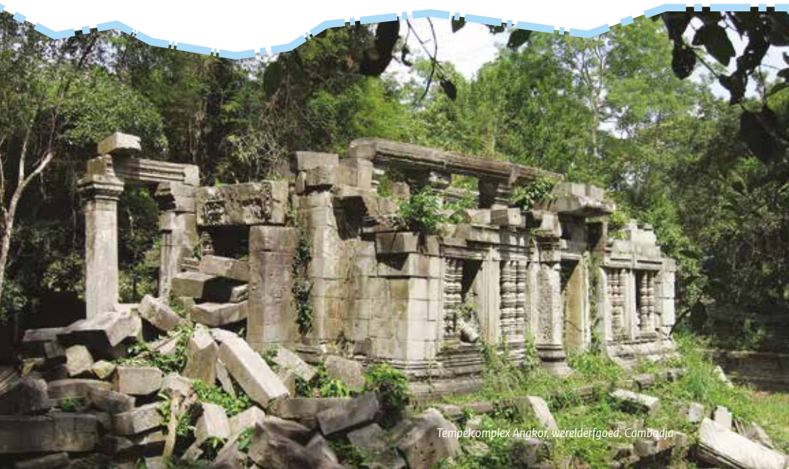
Tempelcomplex Angkor, werelderfgoed, Cambodja