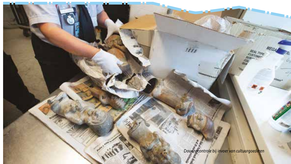
Douanecontrole bij invoer van cultuurgooderen

Stel, uw beeld wordt aan de Nederlandse grens in bewaring genomen. U beroept zich erop dat u het beeld te goeder trouw heeft gekocht en meegenomen, want u had geen idee dat het een beschermd cultuurgood was. Maar voor goede trouw is meer nodig dan goedgelovigheid. U moet alles doen wat redelijkerwijs van u verwacht kan worden om te ontdekken of een voorwerp een beschermd cultuurgood is. Dit geldt voor alle manieren waarop u een cultuurgood verwerft, ook via het internet. U moet ook kunnen aantonen dat u deze moeite heeft genomen (zie kader op volgende pagina). Kunt u dit aantonen, maar blijkt het voorwerp dat u wilt invoeren tóch beschermd te zijn, dan kunt u een beroep doen op goede trouw. Het voorwerp kunt u kwijtraken, maar u maakt aanspraak op een billijke vergoeding.