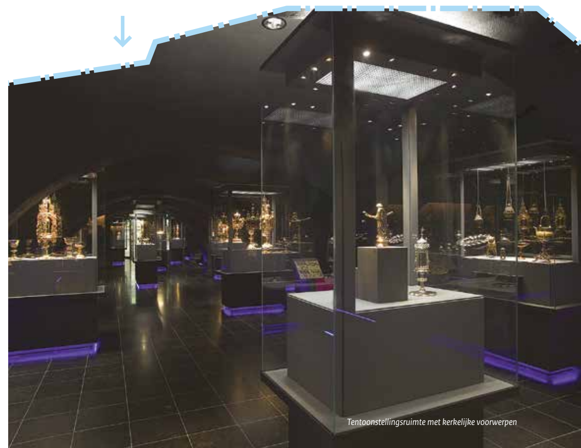
Tentoonstellingsruimte met kerkelijke voorwerpen

De ingevulde formulieren dient u in bij de CDIU, vergezeld van de benodigde herkomstgegevens en (foto)documentatie. Aan de hand van het volledig ingevuld formulier dat de CDIU ontvangen heeft, bepaalt de Erfgoedinspectie of de voorwerpen inderdaad vergunningplichtig zijn. Zo nee, dan wordt u daarvan op de hoogte gesteld. Er wordt nagegaan of de goederen tot het beschermd cultuurbezit van Nederland of een andere lidstaat behoren. De douane en de Erfgoedinspectie kunnen eisen dat een voorwerp voor de vergunningverlening wordt gecontroleerd. Wanneer er geen bezwaar bestaat tegen de uitvoer, verstrekt de CDIU op basis van het aanvraagformulier een uitvoervergunning in tweevoud.